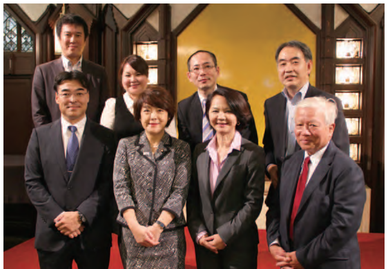
お忙しい公務の中、駆けつけてくださった島尻大臣とともに、WUBメンバーで記念写真。