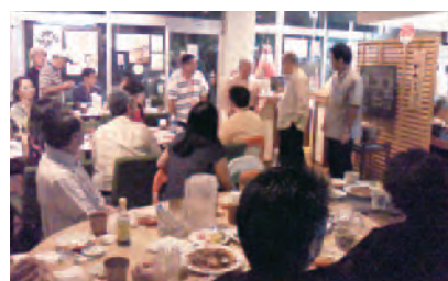
WUB東京ナイト in 沖縄