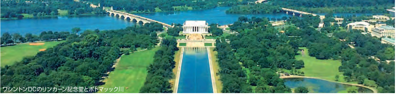
ワシントンDCのリンカーン記念堂とポトマック川