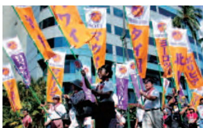
ホノルル、カラカウ通りWUBのノボリが行進