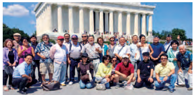
ワシントン DC のリンカーン記念堂の前で