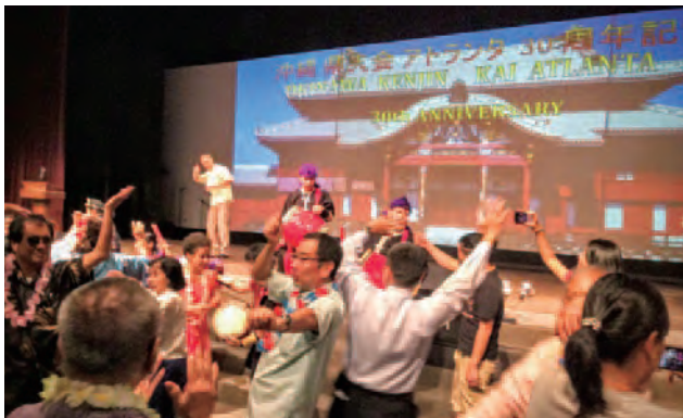
どこにいても締めはやっぱりカチャーシー

The first talk story event attempted to define the “Uchinanchu Spirit”, how social and cultural organizations contribute to the Uchinanchu Spirit. What is the future of the Uchinanchu Spirit? It revealed that Uchinanchu Spirit are: Inclusive – everyone fits in, focused and get things done – Chibariyo! or “Go for It” attitude, responsible for passing on the cultural memory-Okinawan heritage, participate on the global stage – sharing with the world, have pride, spirit and have an abundance of positive energy! This passion and powerful energy led to subsequent events on various issues: Cultural “pride and identity”, US military base issues in Okinawa and what people want for Okinawa – autonomy, democracy, equality status, Uchinanchu longevity, nutrition, and quality of life in old age. Talk Story V further discussions of how the Uchinanchu Spirit evolves in a “foreign” culture and how Uchinanchu perpetuates the Uchinanchu legacy, particularly in Atlanta and other continental US locations and to address the question about what lies ahead for future generations.