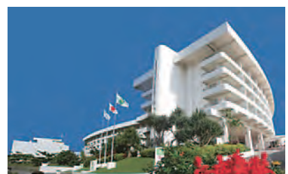
きれいに生まれ変わったコスタビスタ。10周年を迎えた。

沖縄発の世界を救う技術「EM」を体験するためにも、次回帰省した際には利用してみようと思った次第でした。