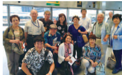
ベルー大会参加に向けて出発の1コマ