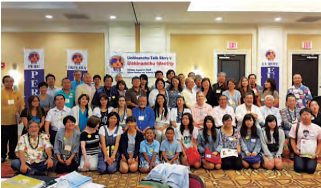
Talk Story V 参加者全員で記念写真

“Uchinanchu Identity” was intended to be an informal “talk story” to share stories about the challenges, and successes in establishing and maintaining one’s identity in an unfamiliar environment and culture. It is also an