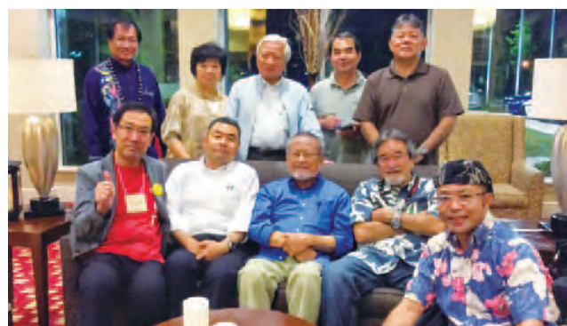
オフィシャルスケジュール終了!

And everything had started in a casual meeting at Atlanta, USA. That show us the importance of this Association and the benefits that brings for our people. We must keep those meetings and expand them to always improve our relationship.