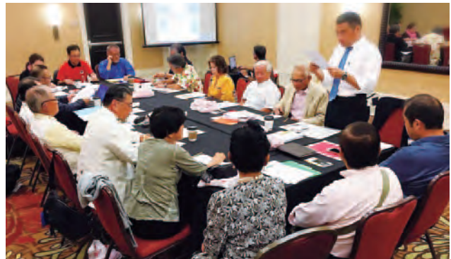
WUBネットワーク理事会。沖縄県ワシントンDC事務所より、山里主幹が参加。

Besides visiting Petrobras, the group had visited the University of São Paulo, the largest University among South America, where they met the most specialist professor in oil department, they saw an earthquake simulation and a high seas storm in an oil navy.