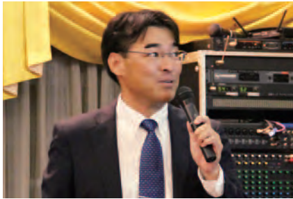
微生物への愛があふれんばかりの安里WUB沖縄会長

「細菌とか微生物ってものすごい可能性を持っているってご存知ですか?」と言われて、「はい、知ってます!」と答えられる人はそう多くないと思います。私自身も当然ながら詳しいわけ