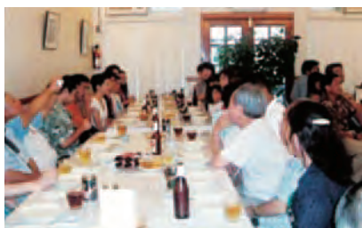
WUB東京ナイト in Hawaii