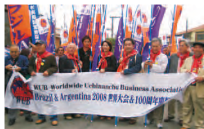
ブラジルでもノボリが行進