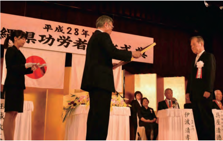
沖縄県功労者表彰式典にて翁長知事より表彰を受ける

私は昨年(平成28年)11月3日の文化の日、那覇市パシフィック・ホテルで開催された「沖縄県功労」表彰、祝賀会で翁長知事より「沖縄県功労・一般篤業部門賞」を頂きました。