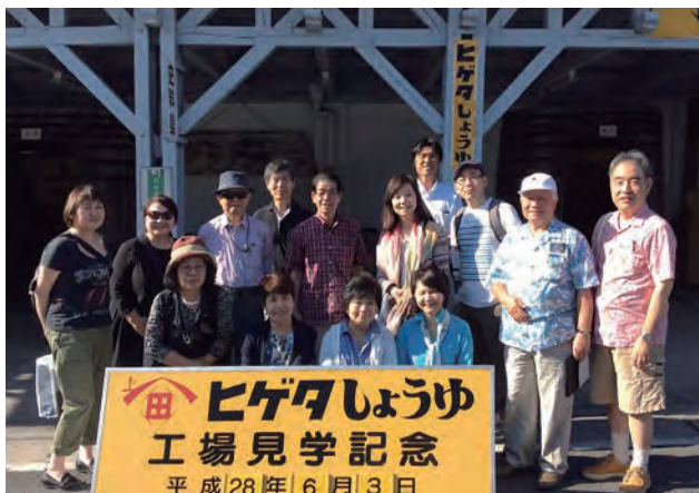
ヒゲタしょうゆを見学

しました。その後、北総地区(千葉県北東部)で一番高い愛宕山の頂上に位置する「地球の丸く見える丘展望館」では、館長に迎え