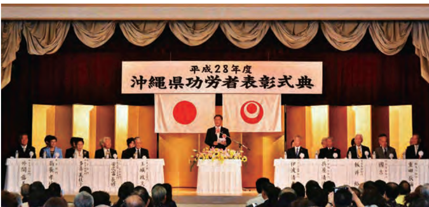
壇上の受賞者と翁長知事のご挨拶