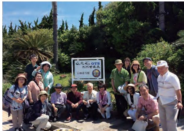
One Two Smile OTS 犬吠埼温泉駅にて