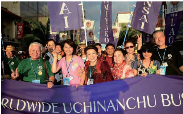
2016年 世界のウチナンチュ大会のパレードにて

72年前の悲惨な戦争を通して強く学んだ平和への希求、平和な国際環境を構築していくにはウチナンチュのチムグクル、ユイマール精神が有用であるとの想いがあります。現在、国際社会は自分が一番、自国が一番と相手や他国を思いやる心が消えかかっているираいがあります。不均衡な経済活動が生む格差社会は貧困問題、精神的荒廃に繋がり争いの要因にもなりうるのです。平和でなければ経済活動を行うことも出来ません。これからはまさに「沖縄“平和経済”宣言」が謳う自分のみならず他者をも尊重し差別や貧困のない多文化共生社会の実現に向けWUB精神を伝播していく時代になります。次世代に向けての壮大なメッセージにもなり得る「沖縄“平和経済”宣言」の採択は本当に意義深かったと思います。