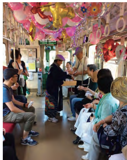
銚子電鉄の車内でたい焼きを購入

天候にも恵まれ、銚子の魅力を存分に味わえた2日間となりました。また、銚子の皆様にも歓迎して頂き、現地の方々と触れ合えた事も良い思い出の1つとなりました。