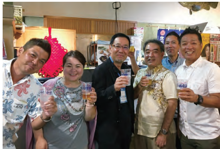
WUB 東京 Night In Okinawa にて WUB 東京会員と

県内の市町村や本土・海外の県人会では、これまでたくさんの移民史が編纂されてきました。新しく完成する県立図書館にも充実した移民コーナーができます。琉球大学にも多くの資料があり、このような機関とも連携し【WUBpedia】プロジェクトをぜひ成功させたいと思います。当事業は、会員から出資を募り【株式会社 WUBpedia】という会社で運営する会員協働のビジネスモデルを目指しています。各支部の皆さんもぜひ前向きに出資を検討してください。