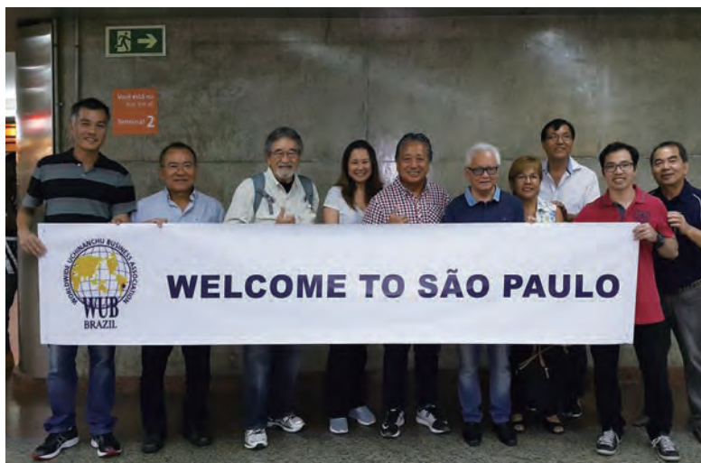
ブラジル サンパウロ空港にてお出迎え