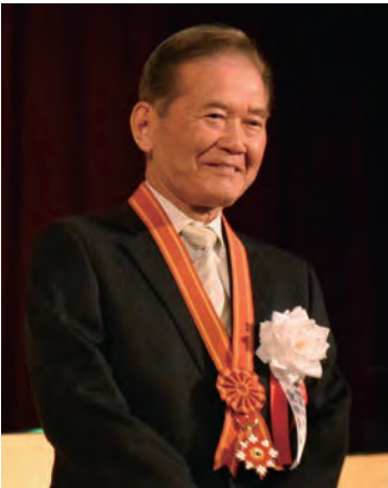
沖縄県功労章を受章

これは初代「WUB東京」会長として“第5回 WUB 世界大会東京2001”の開催、「関東沖縄IT協議会」の立上げ、第7代目の「沖縄経営者協会」会長活動、及びIT企業の(株)日本アドバンスシステムを創業して以来30年間に亘り沖縄県高校生のインターシップ受託をはじめ沖縄県内のIT専門学校、琉球大、沖国大卒の若年者を300人近く採用し育成したことと沖縄に事業所を設立し本土から業務を受注するNear Offshore活動等をご評価頂いたものと思います。