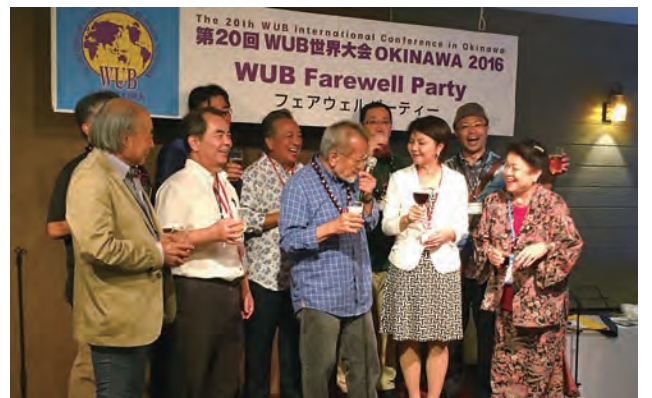
第20回WUB世界大会 OKINAWA2016 フェアウェルパーティーにて

さて、今年でWUB設立から20周年の記念すべき年となり、ハワイにてWUB世界大会及びWUB20周年記念祝賀会が開催されます。この節目の年にWUBネットワークアジ