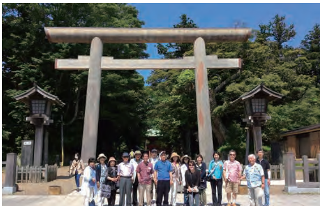
鹿島神社の大鳥居の前で

1日目(6/3)の行程は、9:00に東京駅八重洲口鍛冶橋駐車場に集合して、バスにて「WUB東京 犬吠埼を訪ねて」ツアーに出発しました。最初の観光地である「水郷潮来あやめ園」では、あやめ(花菖蒲)が見ごろを迎え、一面何種類ものあやめが咲き誇っており、散策を楽しみました。通年6月上旬に見ごろになるのですが、この年はあやめの開花が遅れていて、当初予定していた「佐原水生植物園」では、3分咲きの状況で、潮来のあやめ園へ変更して、あやめを楽しむ事ができました。その後、昼食を潮来にある「海鮮倶楽部」で、楽しい女将さんとの会話を楽しみながら銚子