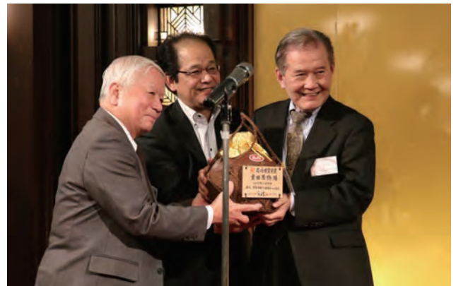
2017年2月15日東京にて受賞祝賀パーティ